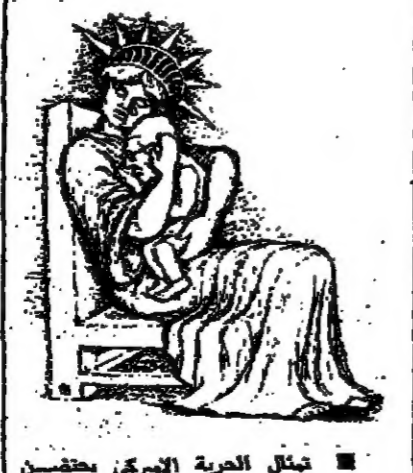
نساء الصورة التي احبها كيسنجر من مجلة « الكريستال » الفرنسية